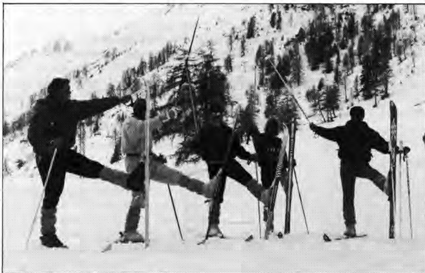
Het ski-team van groep één.

tekst: Norman Candelaria Lex Blok