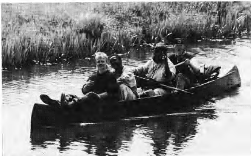
Groep zes op weg, nog vrolijk en monter . . .

Dat was nog voordat we met de bus naar het bossige survivalgebied