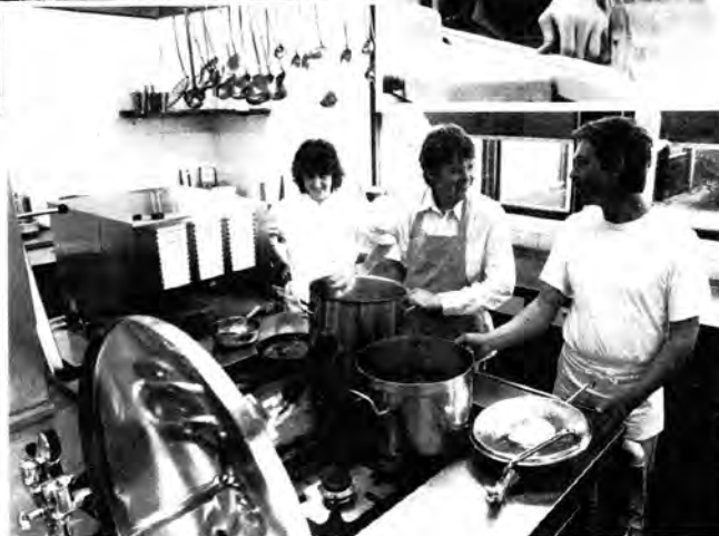
Educatie-activiteiten in Appelscha