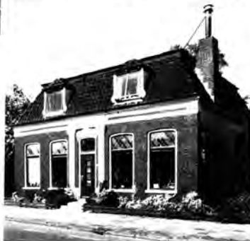
(2) Een blik in een appartement (3) De laatste fase op weg naar zelfstandig wonen: de flats, waarin twee aparte wooneenheden zijn ingericht.