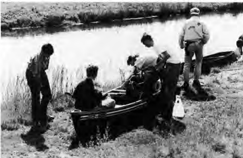
Groep 5 is de dam over. Hoeveel dammen nog.