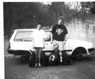
...en de jongens hadden het Douwe laten merken.