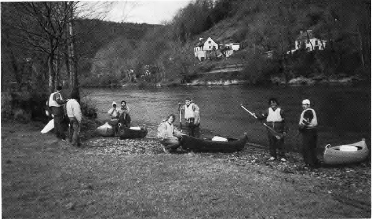
Kanoën op de Dordogne.

over de Dordogne. Sommige jongens kregen last van blaren en iedereen van oververmoeidheid. Nu kon je laten zien of je ook onder erbarmelijke omstandigheden goed voor jezelf kon zorgen, of dat je dat nog moest leren. Eten was er in overvloed de eerste dagen. Maar naar mate de tocht vorderde en de voedselvoorraad niet evenredig slok werd het menigeen duidelijk, dat er toch wel iets te leren valt. Over geluk hadden we niet te klagen want het weer zat echt mee.