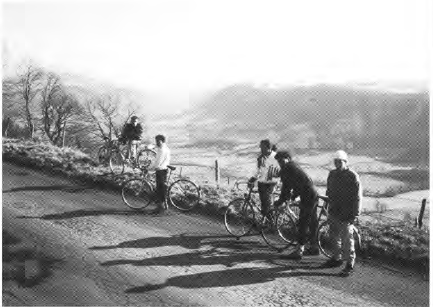
Duizend meter hoog op de fiets.

huis is het trouwens goed toeven. Er is 'n douche, een w.c., er staan bedden en het is er lekker warm, al moet je wel eerst houthakken voor de verwarming.