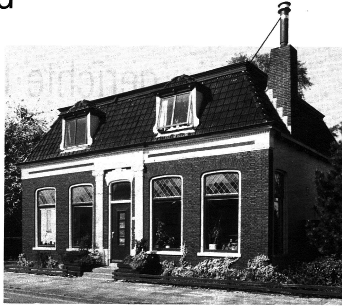
Het fasehuis in Heerenveen, onderdeel van Aekinga

In Groningen, Friesland en Drenthe bestaat een bijzonder interessante situatie. Een aantal organisaties kan zich heel goed richten op een provinciaal bereik. Andere kunnen ook voorzien in een boven- of interprovinciaal aanbod. Dit werkt mee aan een ontwikkeling, die in overeenstemming is met de gewenste interprovinciale koers die de drie noordelijke provincies op allerlei gebied nastreven. Economische versterking van het Noorden is doelstelling van beleid van de drie noordelijke provincies. De centrumfunctie van de stad Groningen zal mede gelet op de Vierde Nota Ruimtelijke Ordening Extra toenemen. Het zou interessant zijn om het jeugdhulpverleningsaanbod ook in dit perspectief te plaatsen en te proberen de interprovinciale dimensie aan het beleid van deze drie provincies met betrekking tot de jeugdhulpverlening te helpen vormgeven.