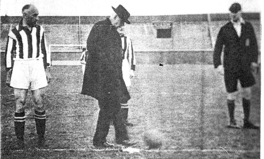
10. In het Ajax-stadion in Amsterdam hebben Amsterdamse oud-internationals gevoetbald tegen Nederlandse oud-internationals. De toen