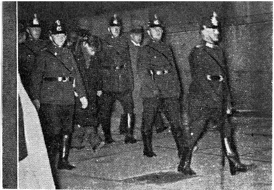
12. Ook het proces Van der Lubbe werd in de aandacht gebracht. Hier zelfs een (schaarse) foto van het gebeuren. In 'De Woudklank' van 19 oktober 1933.